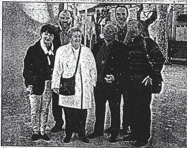
Les membres de l'association pour perpétuer le souvenir des Internées des camps de Brens et Rieucros.

Cependant, comme le souligne la présidente, « l'association, ce n'est pas un devoir de mémoire, c'est un besoin de savoir ». C'est la raison